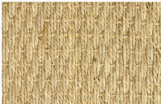
ALGA MARINA - TAIWAN