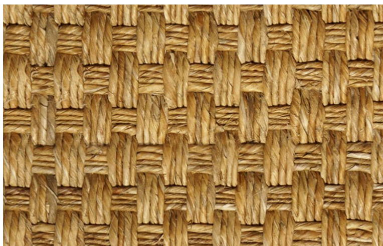
MOUNTAIN GRASS CAUCASO