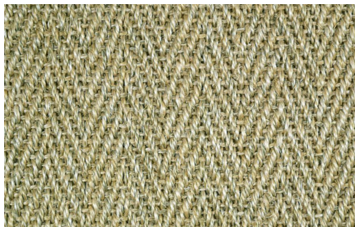
SISAL LOLKY 2025