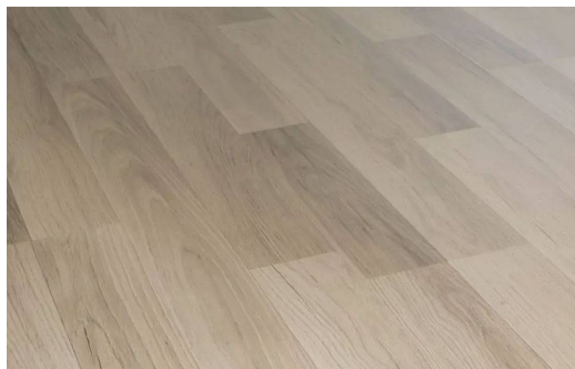
SWISS PRESTIGE D2539 ROVERE ELEGANTE CHIARO