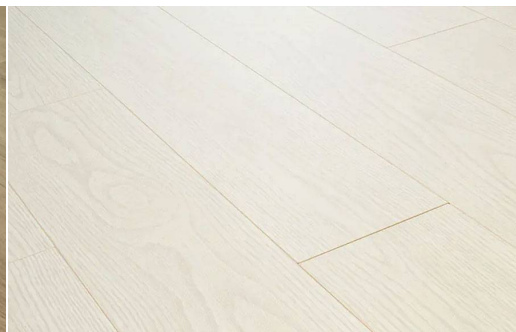
SWISS PRESTIGE D4545 ROVERE URBAN BIANCO