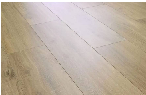
SWISS PRESTIGE D3784 ROVERE LUCERNE