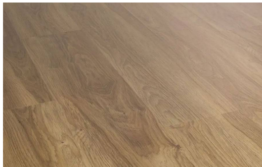
SWISS PRESTIGE D2833 ROVERE CAMARGUE