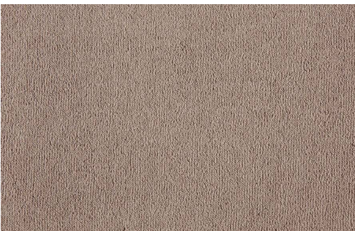
CELESTE 170 SALMONE