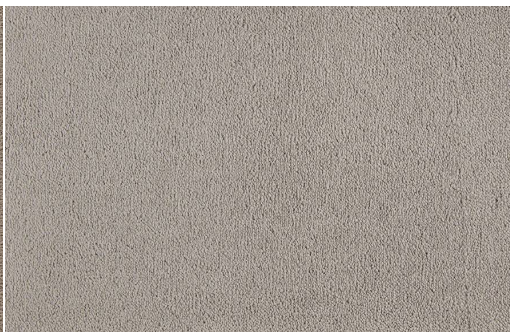
CELESTE 430 LIMO