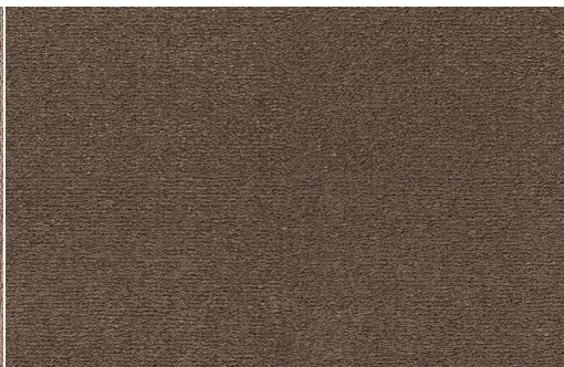
CELESTE 211 TABACCO 1