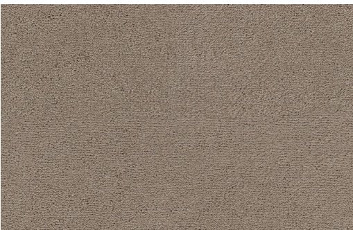
CELESTE 421 CASTORO 1