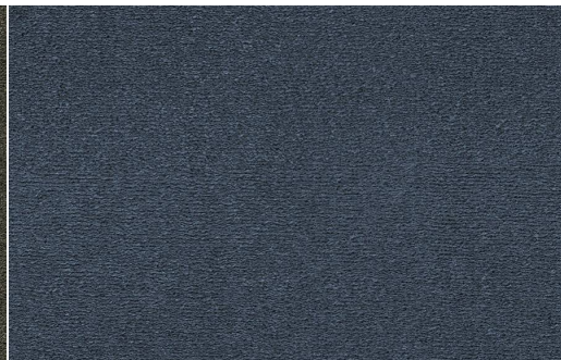
CELESTE 711 BLU NOTTE 1