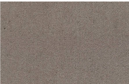
CELESTE 261 BEIGE 1