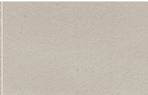
CELESTE 441 AVORIO 1