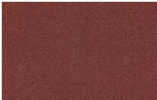
CELESTE 121 CORALLO 1