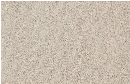
CELESTE 440 AVORIO