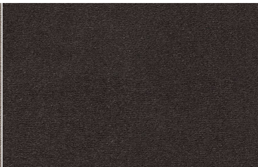
CELESTE 401 CAFFE 1