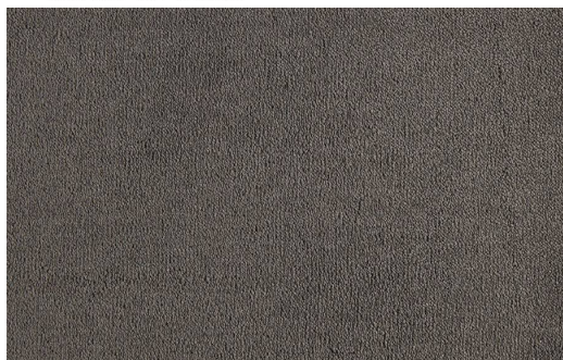
CELESTE 810 ASTRACAN