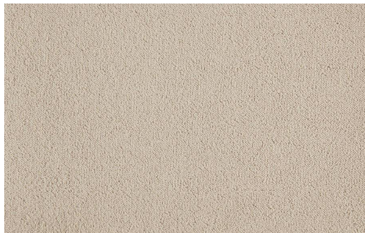
CELESTE 450 SABBIA