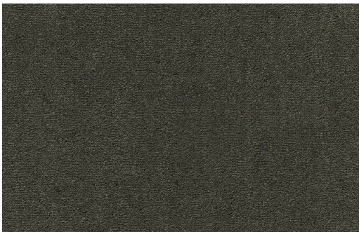
CELESTE 501 OLIVA 1