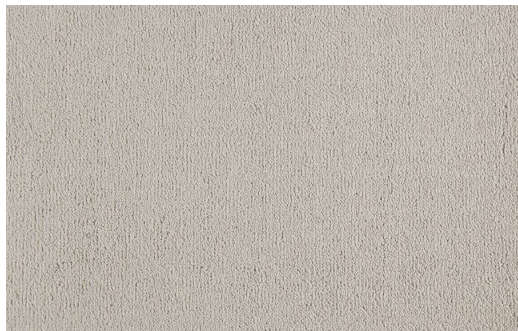
CELESTE 240 CREMA