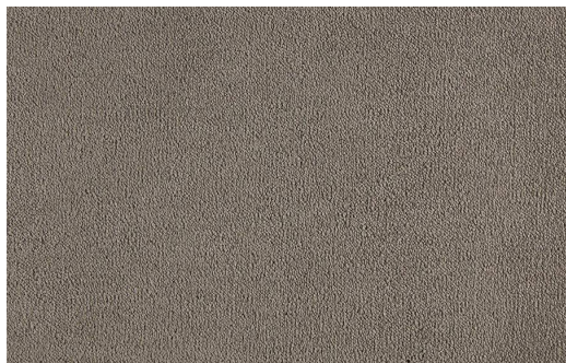
CELESTE 410 CUIOIO