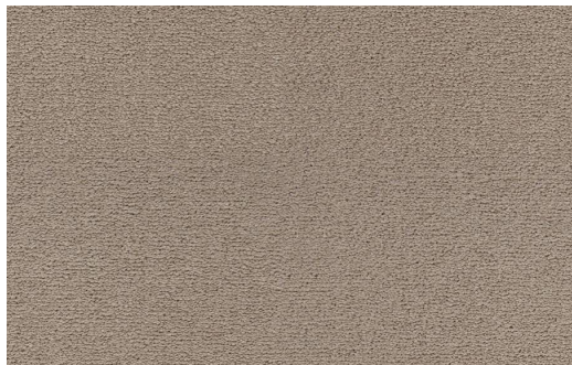
CELESTE 431 LIMO 1