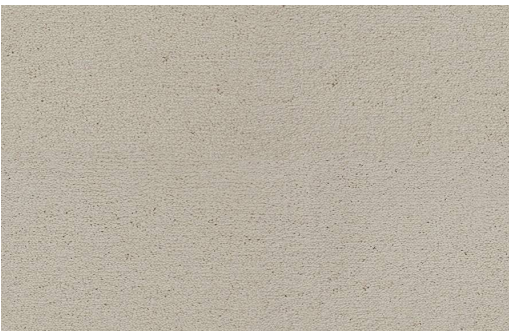
CELESTE 241 CREMA 1