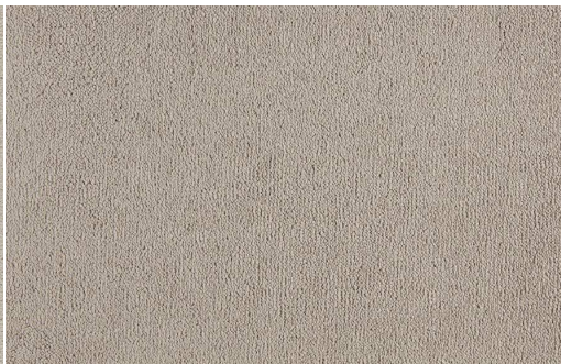
CELESTE 250 NATURALE