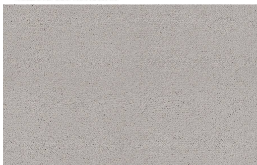
CELESTE 891 BIANCO 1