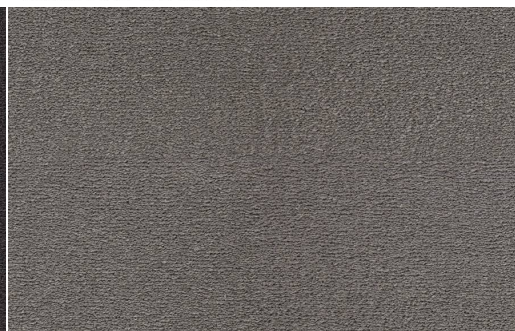
CELESTE 831 CENERE 1