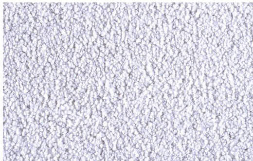
DEA 1605 LUNA