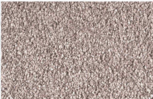
DEA 1604 ARGILLA