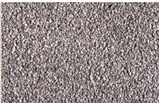
DEA 1616 ALLUMINIO