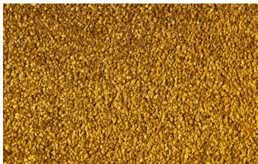
DEA 1615 KAKI