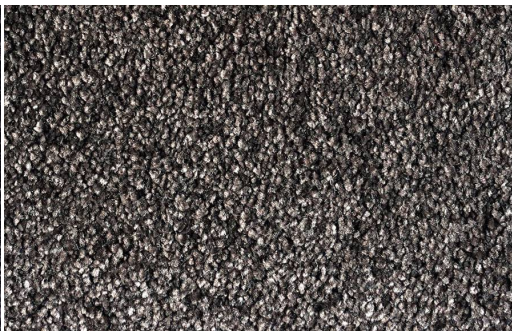
DEA 1611 FANGO