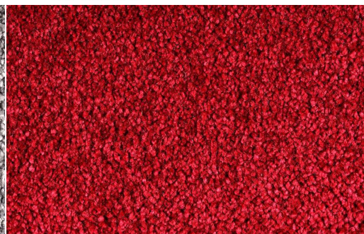
DEA 1617 CILIEGIA