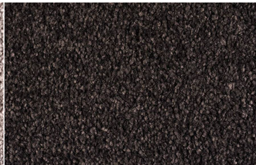
DEA 1607 NICHEL