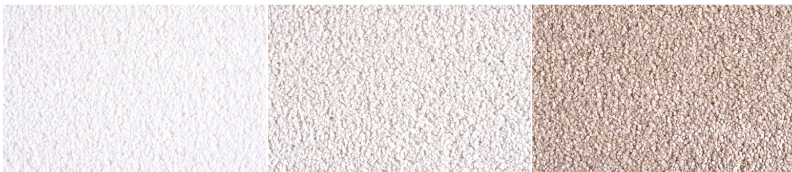
DEA 1601 ZUCCHERO