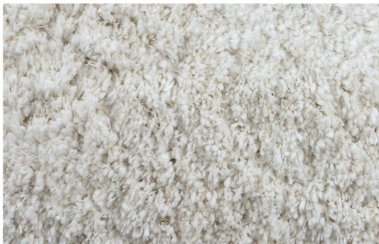
TEDDY 60 NEVE