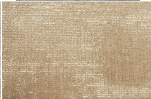
ELEGANCE 186 TAUPE