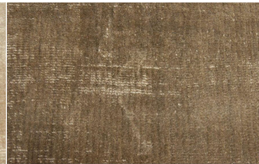
ELEGANCE 187 SILVER BROWN