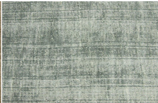
ELEGANCE 978 EGG BLUE