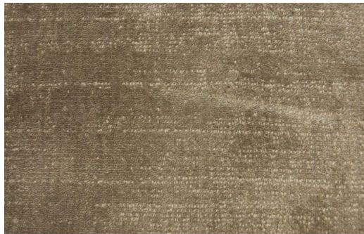
ELEGANCE 188 GREY