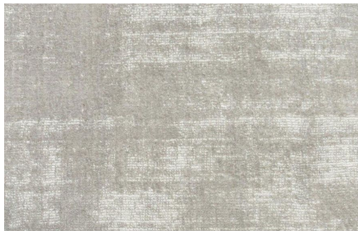
ELEGANCE 178 CLOUD