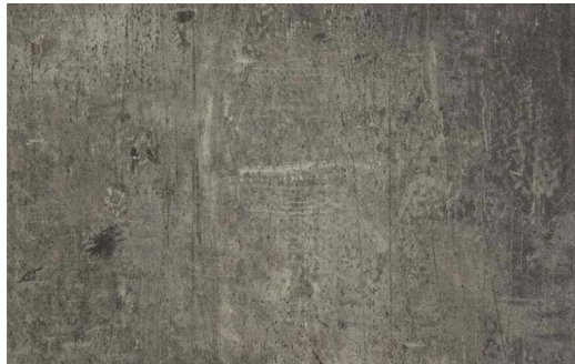
LOFT 599 ALLUMINIO