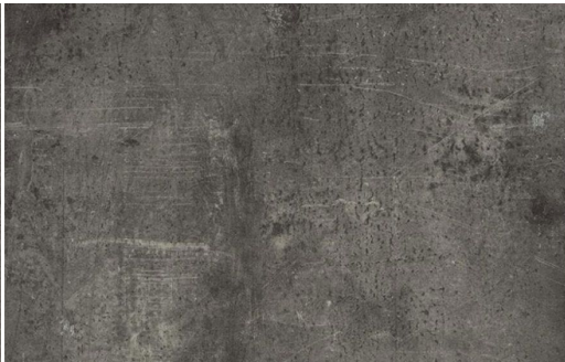
LOFT 553 FERRO