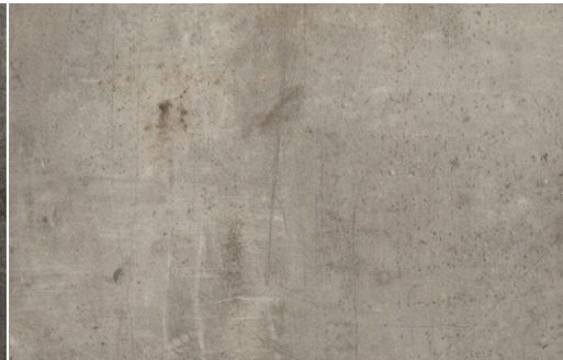
LOFT 533 GESSO