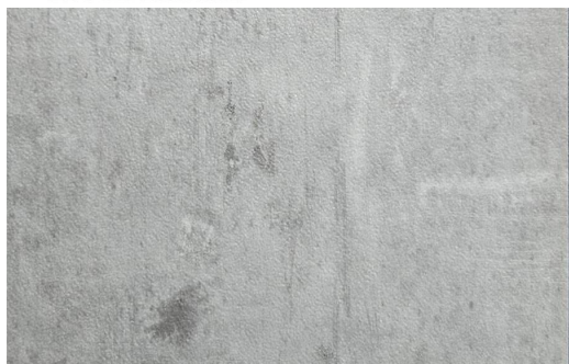
LOFT 510 PERLA