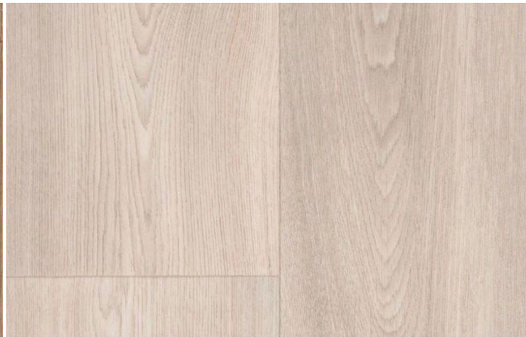
WOOD L 994 LIGHT GRIS