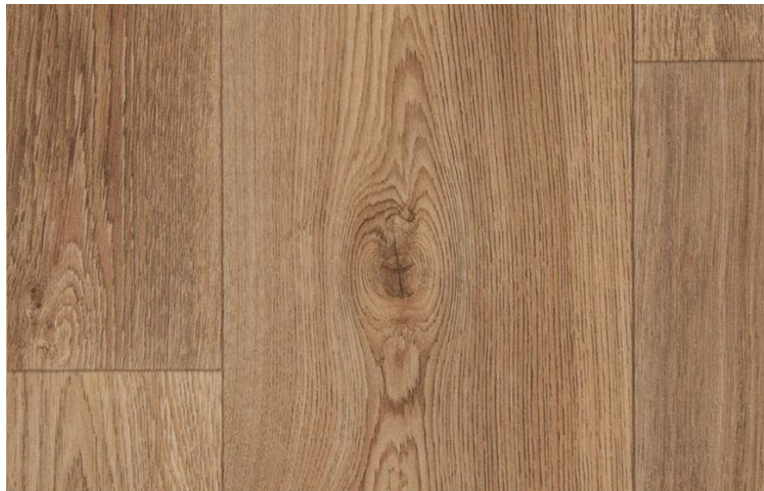
WOOD L 936 OAK NATURE